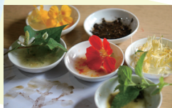
▼TAKAKO氏による ボタニカルアート ペインティング

概要: 「nature sings -listen-」アートワークショップ ※レッスンは英語と日本語で行います 時間: 27th Nov.(Sun) 11:15am (Open) 11:45(Start)-15:00pm(ランチタイム含む) 開催場所: 〒104-0061 東京都中央区銀座 5-8-16 ファンケル 銀座スクエア 10F ロイヤルルーム Venue 5-8-16 Ginza Chuo-ku Tokyo (Tel) 03-5537-0231(代表) 料金: ¥5,400(Tax in)※ランチ付き 定員20名様 ※先着順となります 締切日: 2016/ 11/15(Tue)※お申し込みは銀行振込となります お問い合わせ: 月島アートスクール 〒104-0051 東京都中央区佃 2-14-2 (Tel)090-6511-5388 Contact: Tsukishima Art School Tokyo 2-14-2 Tsukuda Chuo-ku Tokyo ■Website: http://tsukishima-art.com/ ■mail: info@grace-plus-cross.com