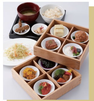
▲ランチは一番人気の「ニの重弁当」