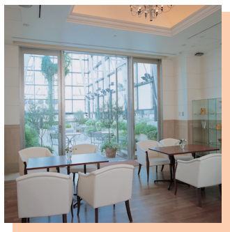
▲10Fロイヤルルームはテラス付きの 優雅な空間です